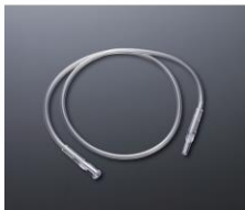
市販の延長チューブ